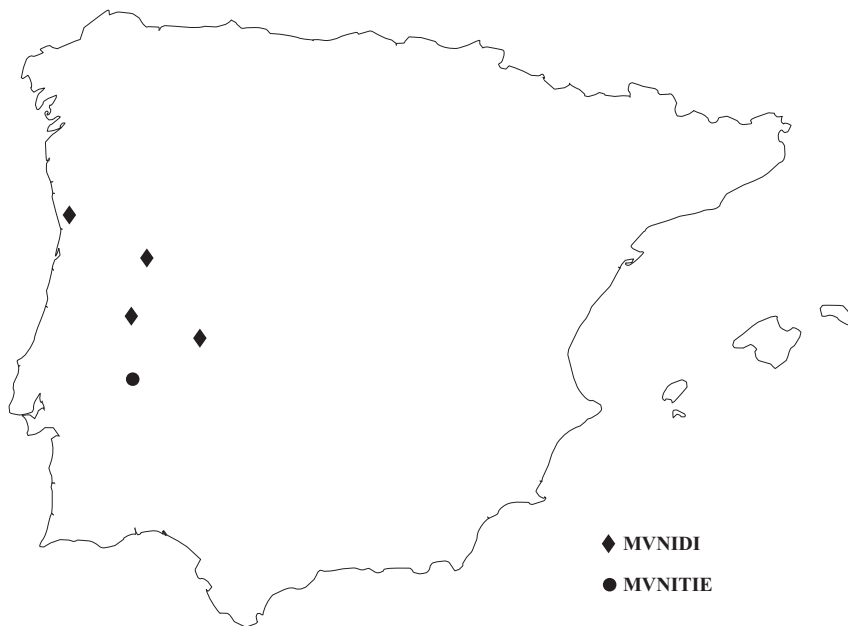
MAPA 4.—TESTIMONIOS Y VARIANTES DE MVNIDI

bles de las lenguas hayan generalizado el grado largo del nominativo a todo el paradigma. En efecto, así sucede en algunas formas celtas, como airl. fili , gen. filed ‘que ve’, en ogámico gen. sg. VELITAS (correspondencia directa del NP de la poetisa germana Veleda ), en los dos casos documentados en avéstico, rauuas-carāt- ‘que circula libremente’ y fra-carāt- ‘que se mueve hacia delante’, y en el tipo en -ητ- del griego, ejemplificado por ἥρης, -ητος ‘que repta’ 14 . En latín se consideran formas primarias y por tanto antiguas los nombres de objeto stīpes , tudes y el adjetivo teres ‘redondo’, que muestran grado pleno sufijal generalizado en toda la flexión.