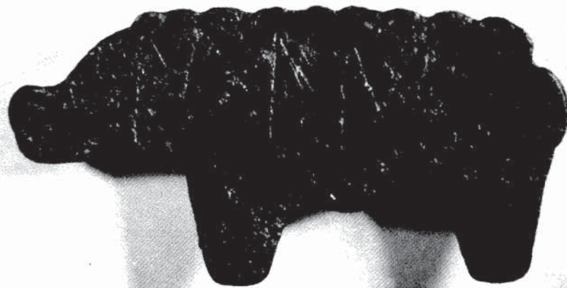
La tésera Rubio Requena. Anverso y reverso (aumentados)